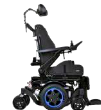
Q300 M Mini