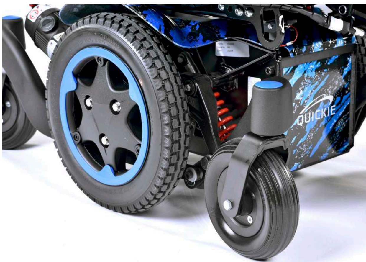
Q300 M Mini Kids

A ultrakompaktowa podstawa o szerokości 520 mm ułatwia poruszanie się w ciasnych miejscach (np. korytarzach i drzwiach).