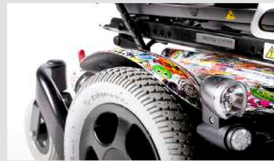
Indywidualna folia do projektowania obudowy/ramy wózka

Jedynym ograniczeniem jest Twoja wyobraźnia