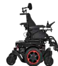
Q300 M Mini Kids