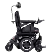
Q300 M Mini Teens